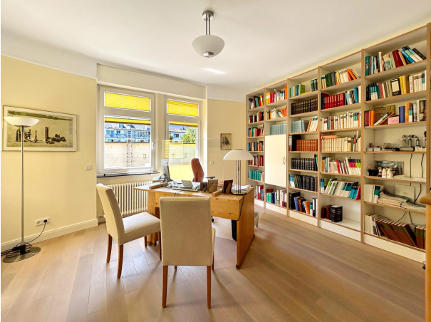
Wartezimmer oder Büroraum