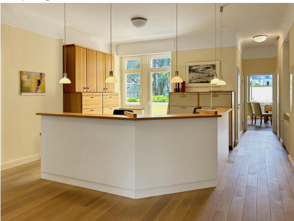
Büroraum mit Balkon