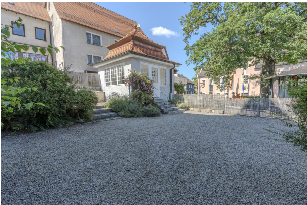
Steingarten / Freisitz