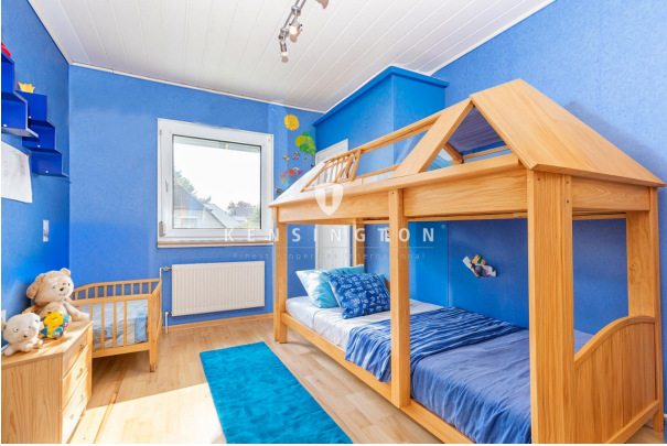
Zimmer III - Staged