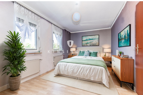
Zimmer I - Staged